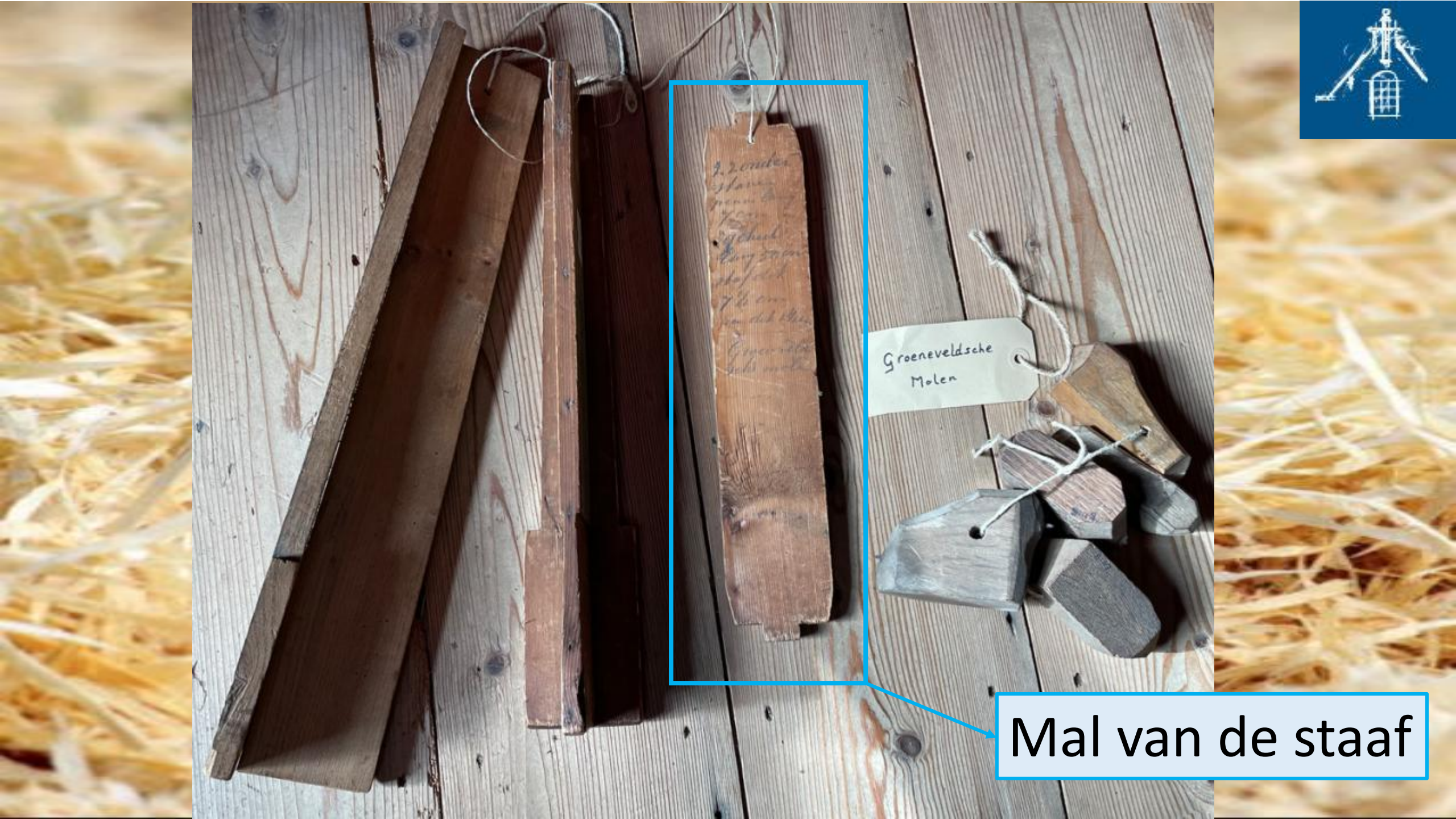
Mal van de staaf