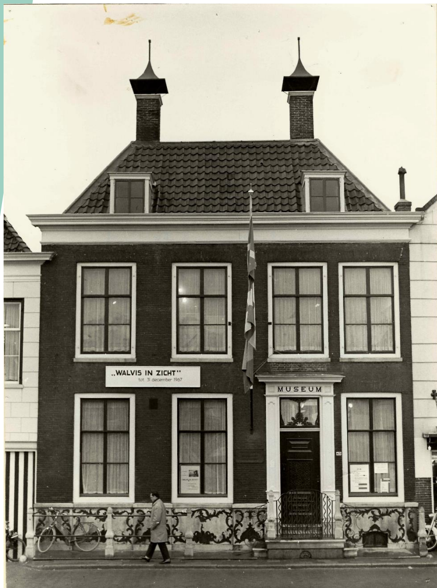
Het Reedershuis aan de Westhavenkade 45.