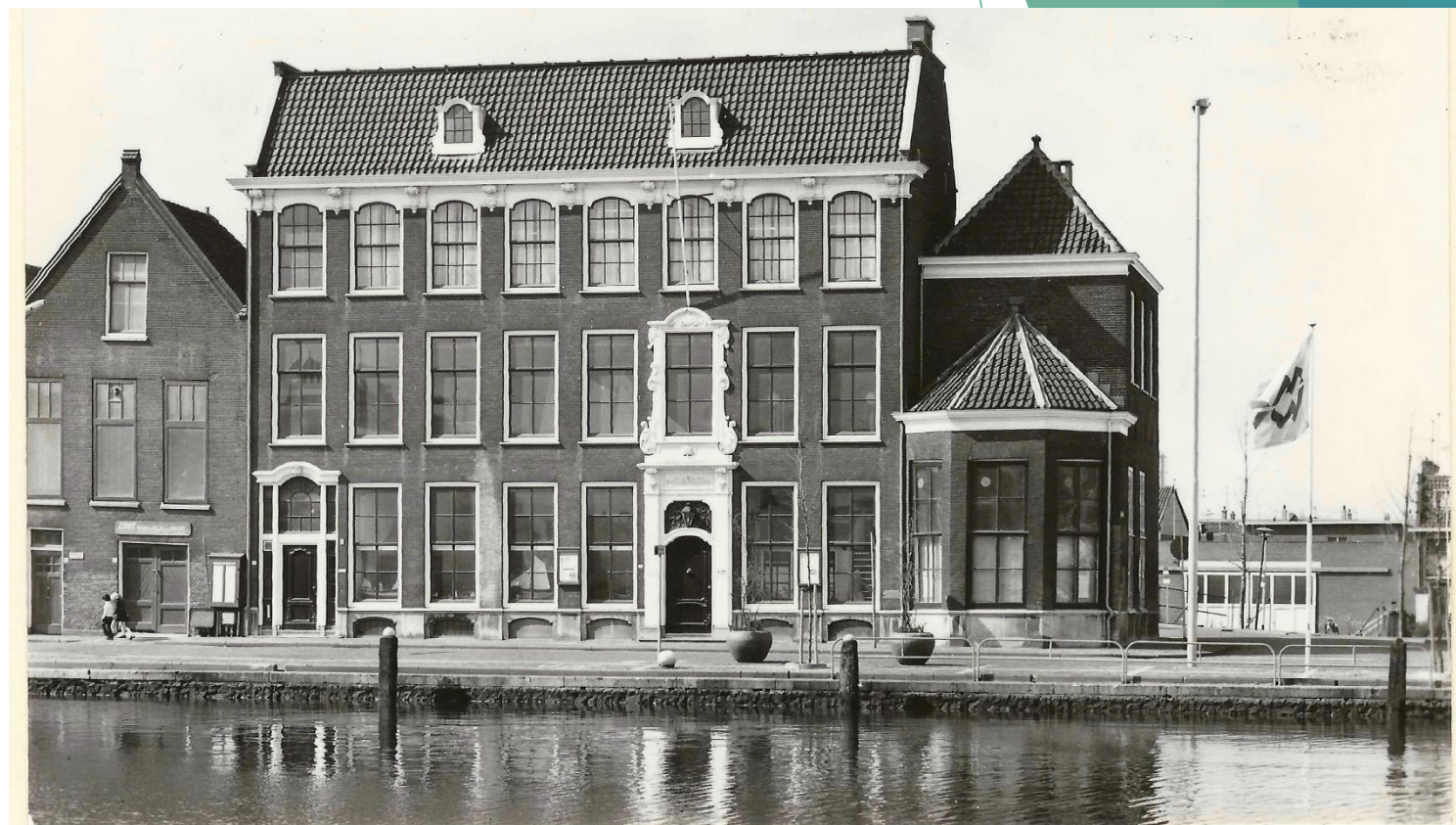
Het Huis met de Lindeboom.