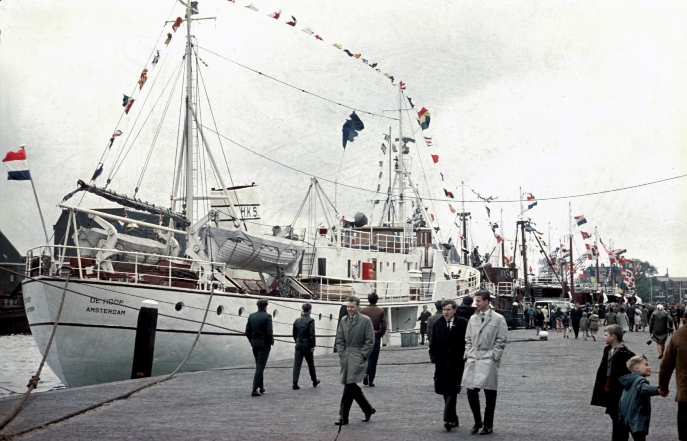
Vlaggetjesdag in Vlaardingen, 16 mei 1959.