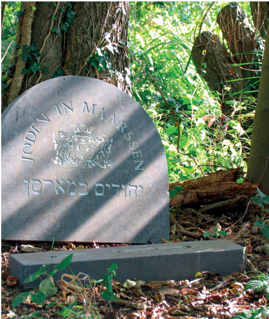
gemeenschap. De begraafplaats ligt ver buiten de gemeente en is zeer moeilijk te vinden

rieur zou daardoor geheel teloorgaan. Ondanks breed internationaal protest werd de verkoop doorgezet.