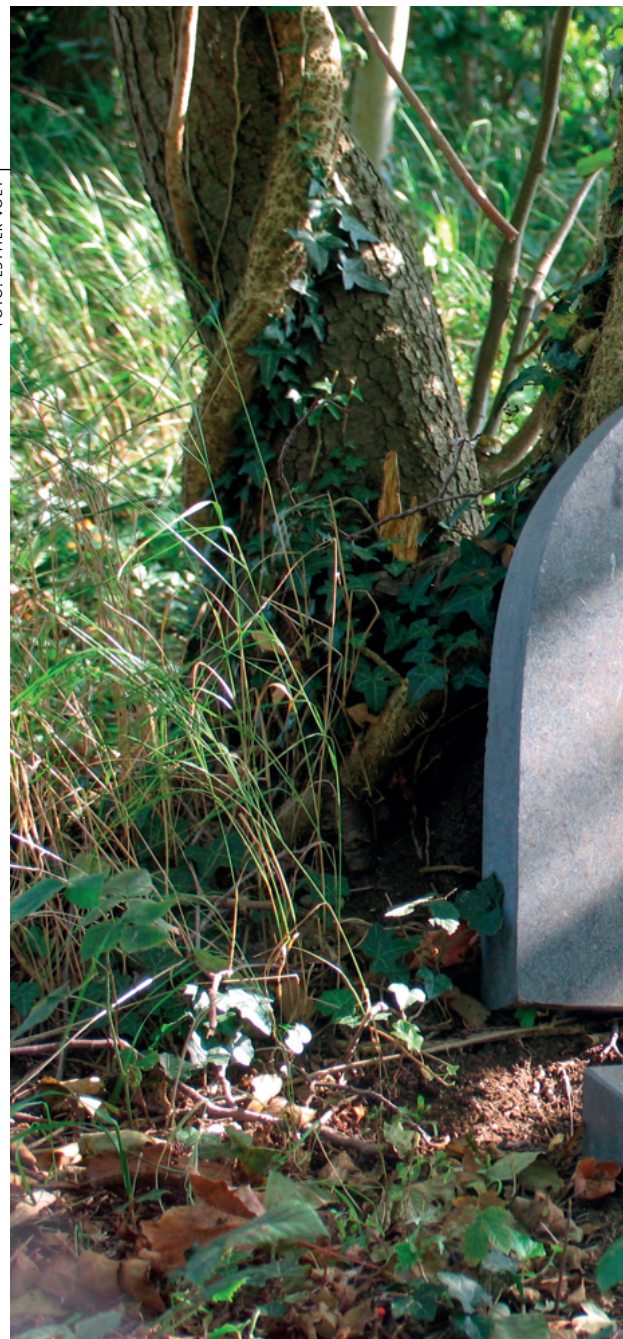
Maarsse van de Vecht kende ooit een levendige Joodse

V an Appingedam tot Meerssen liggen tal van vroegere synagogen, Joodse begraafplaatsen en andere plekken met een Joods verleden. Ze vormen de tastbare weerslag van ruim driehonderd jaar Joden in Nederland. Hoe zijn wij daarmee omgegaan? En belangrijker: voor welke opgave staan we nu?