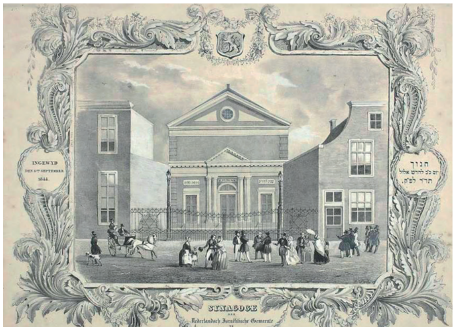
De Grote Synagoge aan de Wagenstraat in Den Haag is nu een moskee. Zelfs de fries op de voorgevel waarop vermeld stond dat daar een sjoel gehuisvest was, wordt nu verhuuld door een Turks opschrift

begraafplaatsen verspreid over het land lagen, vaak in dorpen en stadjes waar nauwelijks of geen Joden meer woonden. Die begraafplaatsen moesten wel onderhouden worden. De meest voor de hand liggende partner daarbij was de gemeente. Die was daar in tal van gevallen alleen toe bereid als er iets tegenover stond: overdracht van grond of panden.