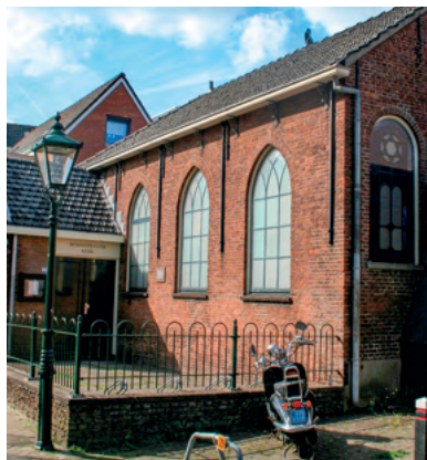
In de synagoge in Alphen aan den Rijn huist sinds het einde van de oorlog de remonstrantse gemeente