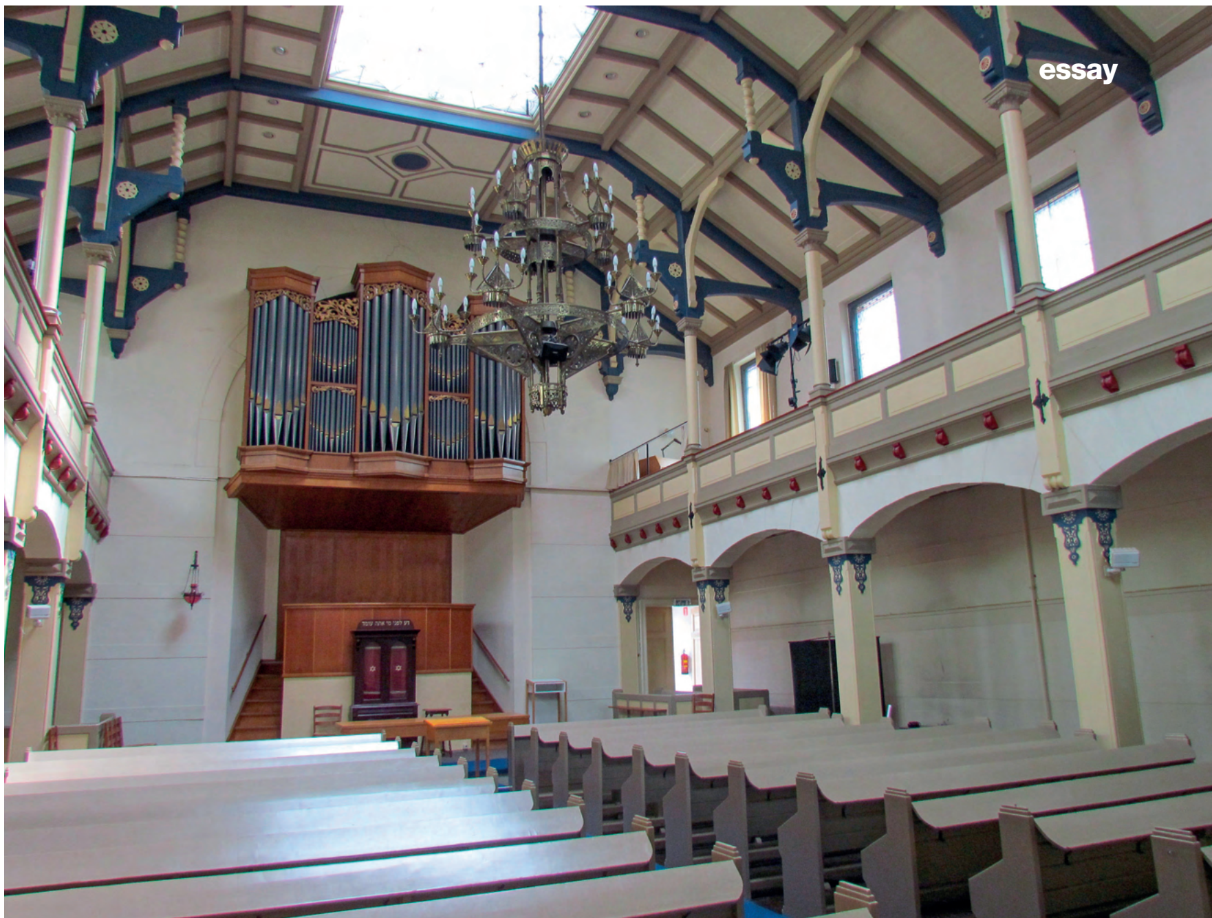
Interieur van de Grote Synagoge in Deventer. Voor het behoud van deze sjoel werd lang gestreden, maar uiteindelijk gooiden de initiatiefnemers de handdoek in de ring

voor sentimentaliteit. Wilde men het Joodse leven wederopbouwen, dan moest vooruitgekeken worden. Men moest van de molensteen verlost worden. Bovendien was er nog een reden om de oude vertrouwde panden te verlaten: er lagen te veel herinneringen aan een leven dat definitief voorbij was.