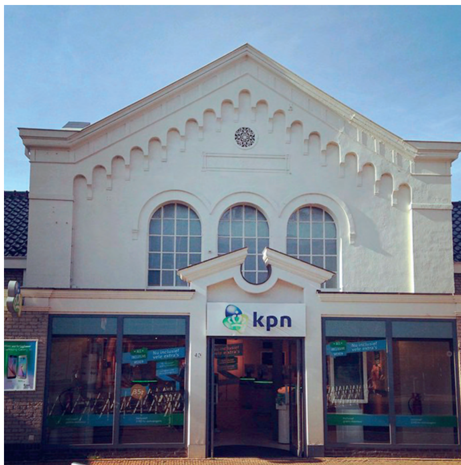
De synagoge in Zaandam is nu een telefoonwinkel, maar een deel van het gebouw is ingericht als informatiecentrum over het Joodse verleden van Zaandam

De omgang met Joods erfgoed in naoorlogs Nederland