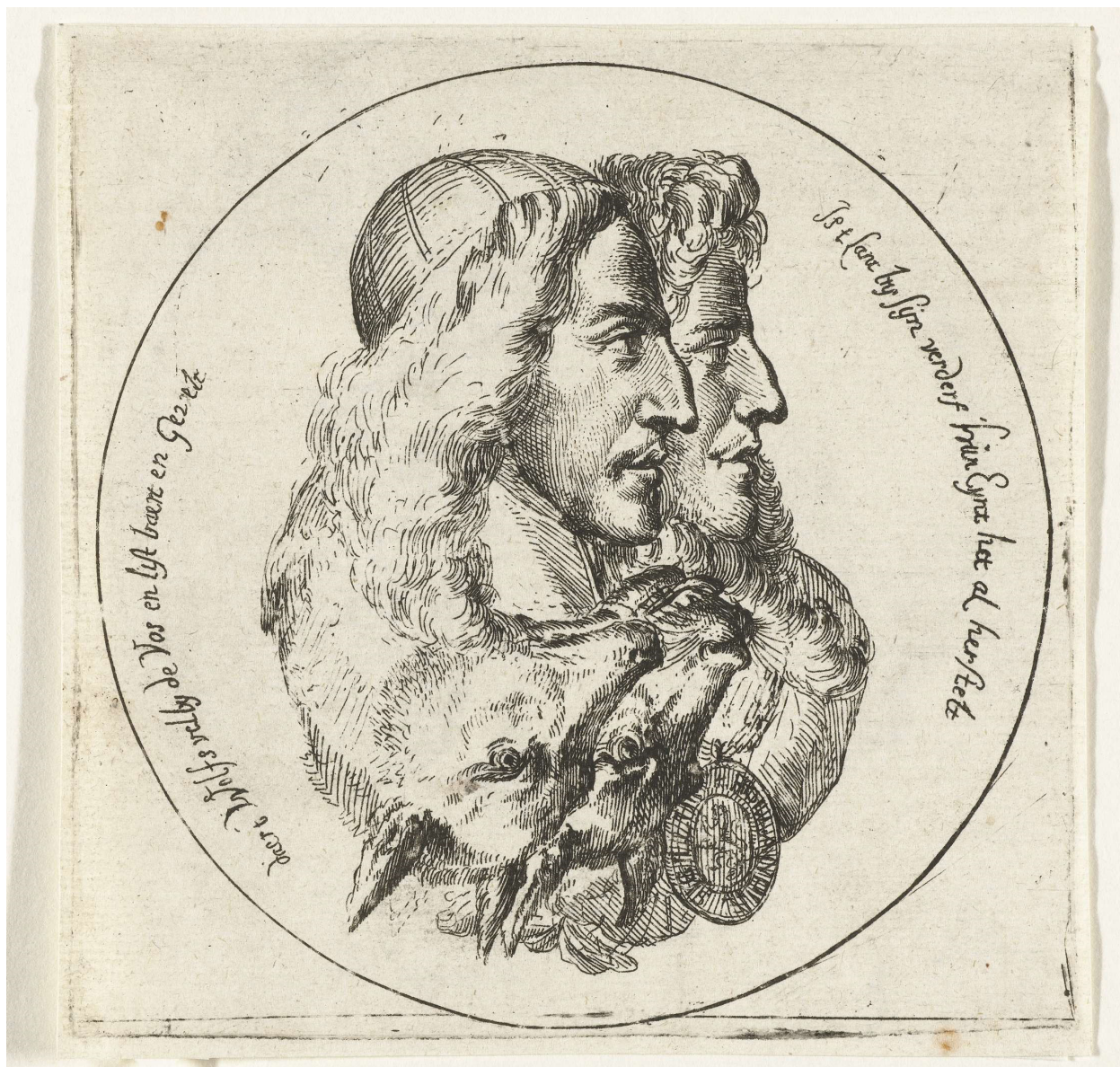
Portretten van de gebroeders de Witt als een vos en een wolf Romeyn de Hooghe (toegeschreven aan) 1672 (Rijksmuseum Amsterdam)