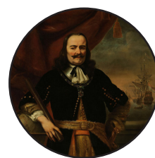
Michiel de Ruyter