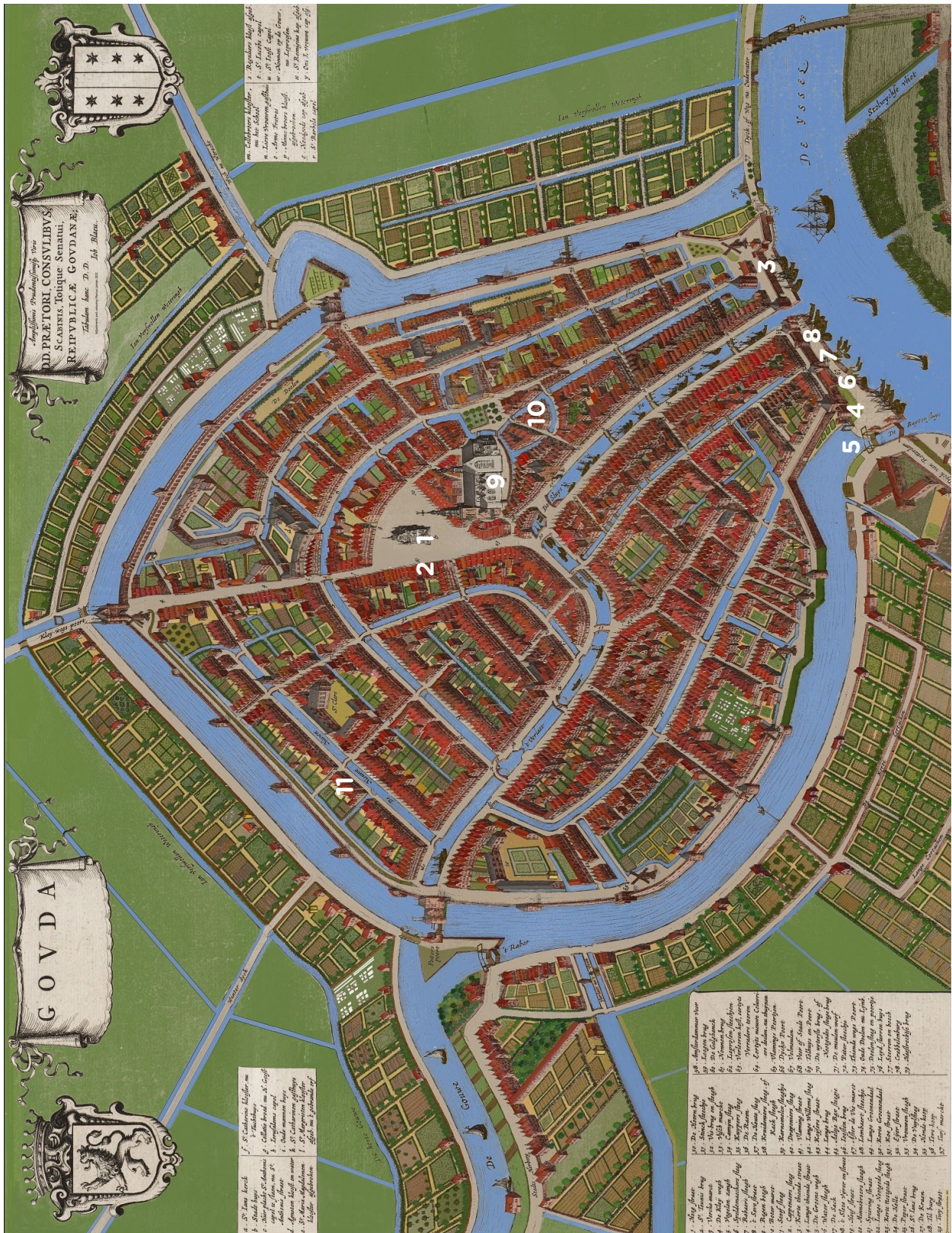
Kaart Gouda Johannes Blaeu, 1649