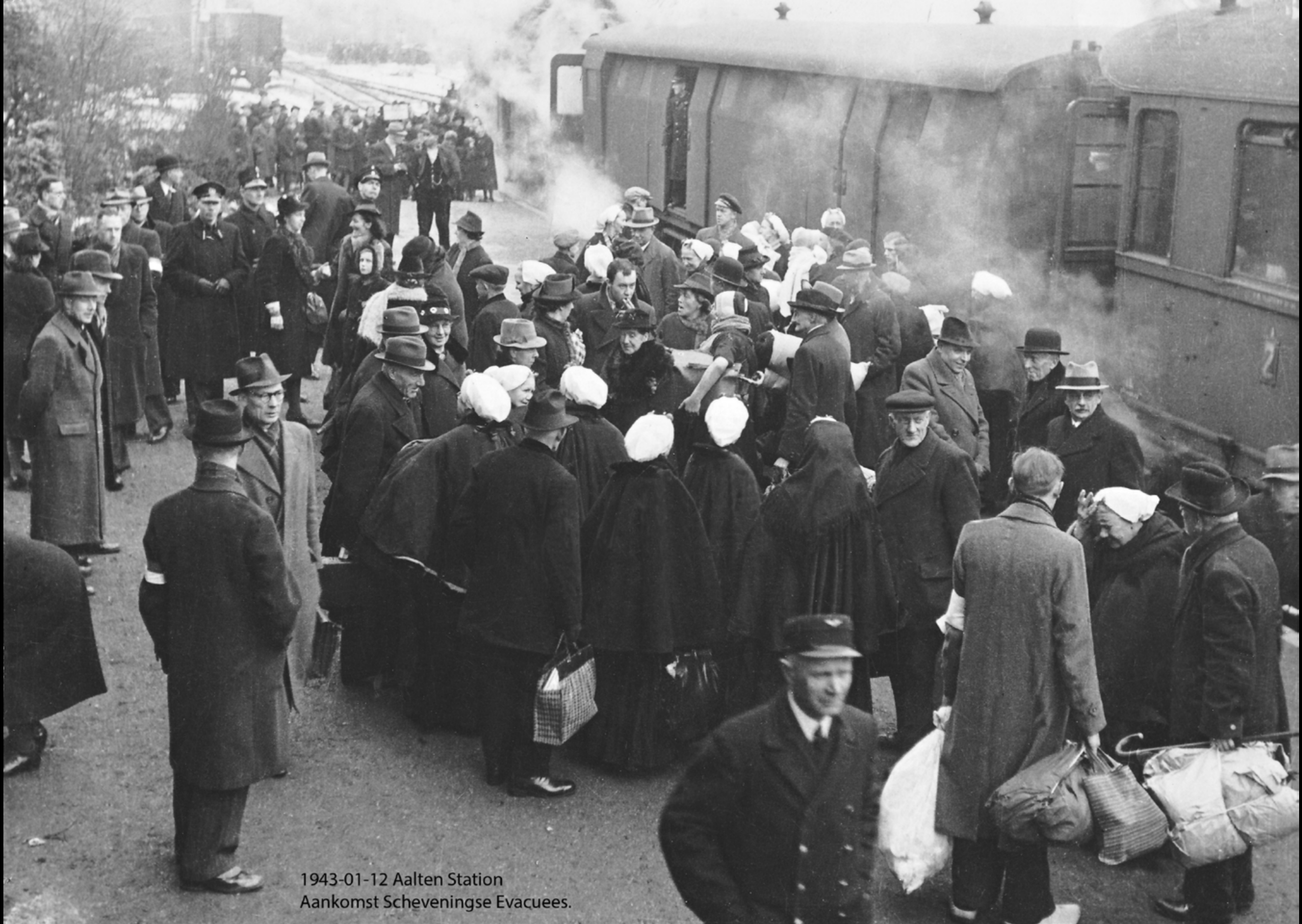
1943-01-12 Aalten Station Aankomst Scheveningse Evacuees.