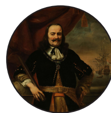
Michiel de Ruyter