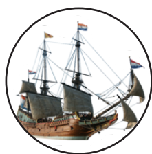
De VOC en de WIC