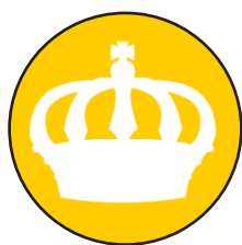
Tijd van regenten en vorsten