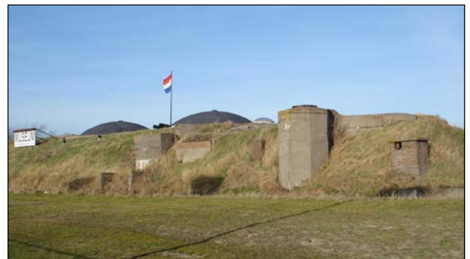
13 Fort 1881, Hoek van Holland

Het fort zelf werd gebruikt als hospitaal, arrestantenverblijf en bakkerij. Iedere dag werden er wel 5.000 broden gebakken voor de Duitse troepen in de bunkers en de stellingen rond het fort. Hoe zag het dagelijks leven van de Duitse soldaat er uit? En wat troffen de bewoners aan toen ze na jaren weer terugkwamen in hun dorp?