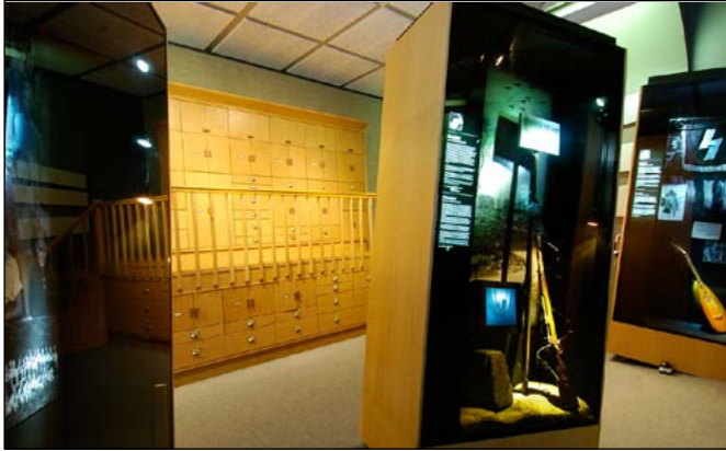
10 Foto van de tentoonstelling 'Kind in Oorlog'. Dit is onze permanente Tweede Wereldoorlog-tentoonstelling. Deze krijgt een aanvulling over de Atlantikwall en vormt dus ook de uitvalsbasis voor de les.