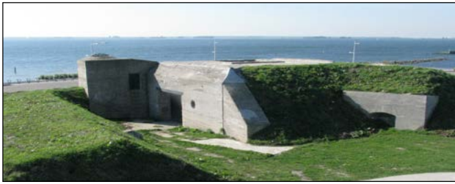
15 Bunker bij de vesting van Hellevoetsluis