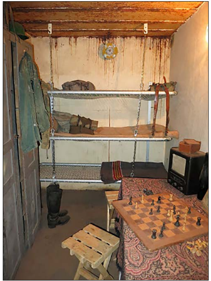
3 Interieur bunker Scheveningen

Om in zo kort mogelijke tijd zoveel mogelijk bunkers te kunnen bouwen, was de bouw van de bunkers gestandaardiseerd. De Duitsers noemden dat Regelbau. Het voordeel hiervan was dat er van tevoren bekend was hoeveel bouwmaterialen en arbeidskrachten er nodig waren.