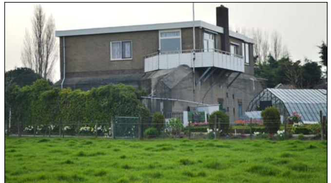
11 Een villa met een bunker als fundering in 's-Gravenzande

Het dorp Ter Heijde werd voor de bouw van de Atlantikwall volledig gesloopt. Bij het Arendsduin, tussen 's-Gravenzande en Ter Heijde, lag een groot bunkercomplex, een van de toegangen tot de Festung Hoek van Holland. Het complex heette Sperre Arendsduin en omvatte 17 bouwwerken. De bunkers zijn er nog wel, maar zijn niet meer te zien. Ze worden bijvoorbeeld gebruikt als fundering van verschillende villa's en als opslagplaats.