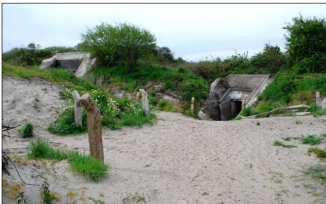
16 De Punt, Goeree-Overflakkee

Plein Fort Haerlem 1 3221 AW Hellevoetsluis 06-31 25 49 09 excursie@fronttaal.info www.fronttaal.info