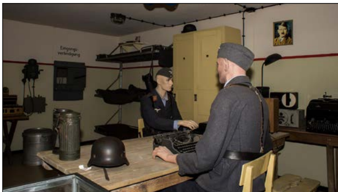
14 Interieur Biberbunker, Oostvoorne

In de duinen bij Oostvoorne bouwden de Duitsers een grote bunkerstelling, de Biberstellung. Dit systeem bestond uit 97 bunkers. Een van deze bunkers is de Biberbunker die werd gebouwd als radarcommandopost voor de Duitse luchtmacht. Van hieruit werden acties ondernomen om geallieerde bommenwerpers te onderscheppen die op weg waren naar Duitsland. De Biberbunker was onderdeel van een radarketen die tijdens de Tweede Wereldoorlog door de Duitsers werd aangelegd om zich te verdedigen tegen geallieerde bommenwerpers die over Nederland naar Duitsland vlogen. Langs de kust van Nederland, België en Frankrijk waren 14 radarcommandoposten, drie ervan stonden in Nederland: op Terschelling, in Zandvoort en in Oostvoorne. De Biberbunker was het zenuwcentrum van de stelling Biber. Hier kwamen de eerste radarsignalen al binnen als de vliegtuigen in Engeland opstegen. De radars stonden in de omgeving van de bunker en de gegevens die de radars opvingen, werden samengebracht in de Biberbunker.