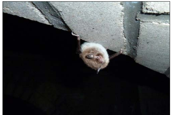
4 Vleermuis in batterij Vineta in Hoek van Holland

voor vleermuizen. In de loop der jaren zijn veel bunkers met zand bedekt geraakt en onzichtbaar geworden, nu worden steeds vaker bunkers uitgegraven en opengesteld voor publiek. Zo kunnen we zien hoe de Duitse soldaten er tijdens de Tweede Wereldoorlog hebben geleefd en blijven de bunkers ons herinneren aan de gebeurtenissen die hier hebben plaatsgevonden.