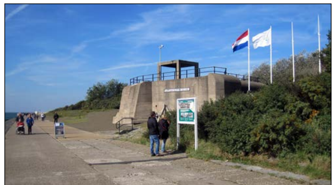
12 Atlantikwall Museum, Hoek van Holland

Bij het Staelduinse Bos bouwden de Duitsers een groot bunkercomplex dat een van de drie zwaar verdedigde toegangen was tot de Festung Hoek van Holland. De Maasdijk was een belangrijke en strategische verbinding tussen Hoek van Holland en het achterland. De bunkers van het Staelduinse Bos worden tegenwoordig gebruikt als verblijfplaats voor vleermuizen.