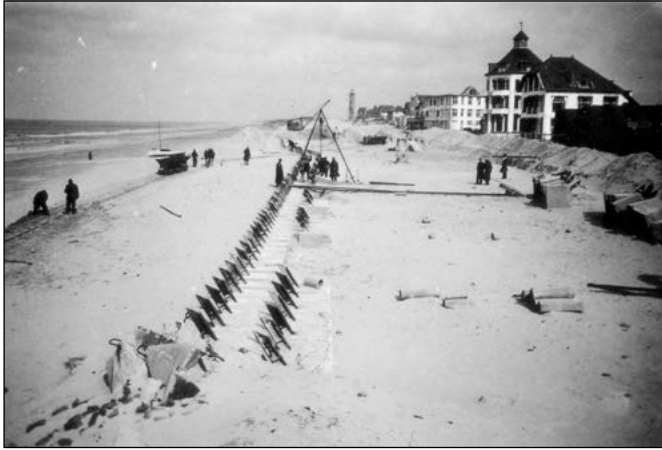
2 Drakentanden op het strand van Noordwijk in 1945.