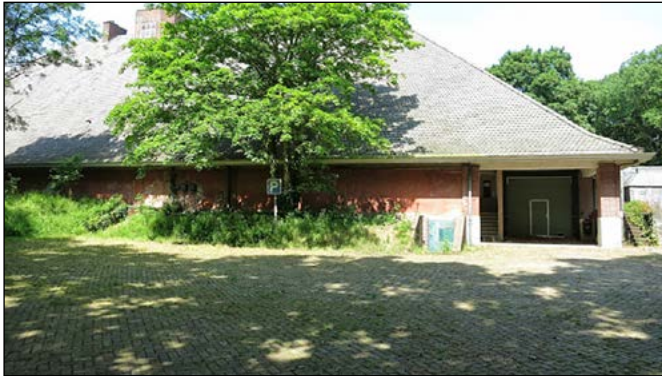
8 De boerderij/bunker van Seyss-Inquart

In de Oostduinen bij het Zwarte Pad zijn restanten te zien van kustbatterij Scheveningen Nord. In de parken Aerendsdorp en Clingendael zijn restanten zichtbaar van het voormalige landfront. Ook de boerderijbunker van Seyss-Inquart staat er nog, op de hoek van de Wasse-naarseweg en de Thérèse Schwarzestraat.