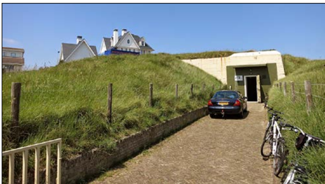
5 Bunker in Noordwijk

Voor de oorlog werden de Noordduinen in Noordwijk gebruikt als golfterrein. Maar eind 1940 liet de Duitse marine zijn oog erop vallen en besloot er 180 soldaten te legeren. Voor deze soldaten moesten woonverblijven, wasruimtes en gevechtsofstellingen worden gebouwd. Om het beton dat nodig was voor de bouw van de bunkers hier te krijgen, lieten de Duitsers een spoorlijn aanleggen. Toen de bunkers klaar waren, werden ze gecamoufleerd door er zand overheen te scheppen en er vervolgens grasmatten van de golfbaan overheen te leggen. De hele oorlog door werd er verder gebouwd. Na de bevrijding trokken de soldaten weg en lieten de kanonnen achter. Na de oorlog werden de kanonnen weggehaald en verwerkt tot schroot. In de jaren vijftig en zestig waren de bunkers een gewild speelterrein voor kinderen. Begin jaren zeventig werden ze weggewerkt onder het zand, maar de afgelopen jaren zijn er bunkers uitgegraven en toegankelijk gemaakt. De grootste bunker, een munitieopslagbunker, is er nog. Hier is tegenwoordig het Atlantikwall Museum Noordwijk te vinden.