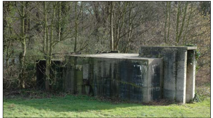
9 Bunker in Park Overvoorde

Op de website www.destadgeschonden.nl zijn routes te vinden door onder meer de wijk Duindorp in Scheveningen en door het landgoed Clingendael.