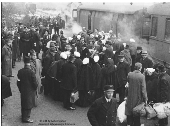
6 Aankomst Scheveningse evacués op station Aalten in januari 1945

In het voorjaar van 1942 werd het strand en duingebied bij Scheveningen tot verboden gebied (Sperrgebiet) verklaard door de Duitsers. Al snel daarna werden 350 woningen in de kuststrook van Duindorp en Scheveningen-Dorp ontruimd en gesloopt. Eind oktober 1942 werd het Sperrgebiet uitgebreid. Zo'n 30.000 woningen werden gesloopt en bomen in bossen en plantsoenen werden gerooid. Ongeveer 135.000 Hagenaars moesten hun woning verlaten voor de bouw van Stützpunktgruppe Scheveningen. Veel van de evacués kwamen terecht in Aalten en Winterswijk in Gelderland.