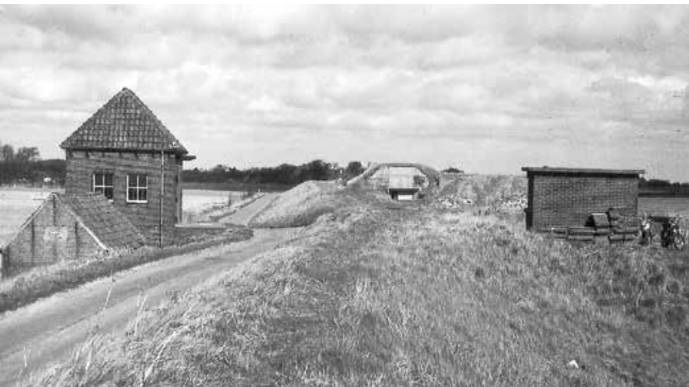
Links het gemaal, in het midden de manschappenbunker