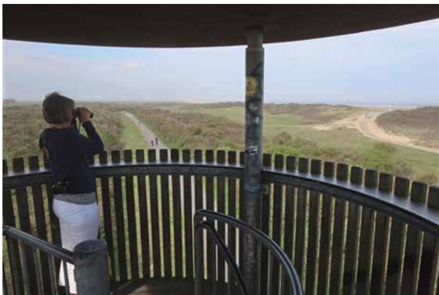
Bij KP 55 geeft een uitzichttoren een mooi overzicht over duin en zee