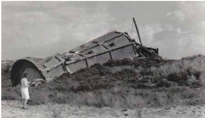
De vernielde vuurtoren, net na de bevrijding

De vuurtoren van Ouddorp domineert al van verre de omgeving. In de oorlog stond hier een andere vuurtoren, waarvan de Duitsers het licht in 1940 doofden om de geallieerde schepen geen oriëntatiepunt te bieden. Het vijftig meter hoge betonnen gevaarte deed vanaf toen dienst als meetpost voor zwaar kustgeschut dat bij Rozenburg stond opgesteld. Later werden de lampen bovenin verwijderd om plaats te maken voor een radar die schepen op grote afstand kon signaleren. Volgens de bevolking werd in de nacht van 4 op 5 mei 1945, kort voor Duitse capitulatie, de toren opgeblazen. De Duitsers hielden het op blikseminslag. De huidige vuurtoren is gebouwd in 1947-1948, is 52 meter hoog en heeft de krachtigste bundel licht in Nederland (sterkte: 5,2 miljoen kaarsen).