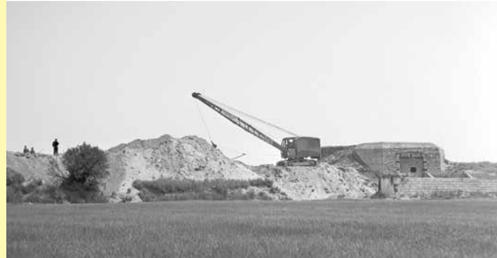
Sloop van een bunker in Batterij Goedereede