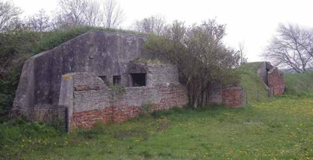
Bunkers ter camouflage gebouwd in de zandwallen en schurvelingen