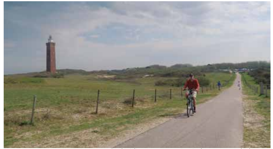
De huidige vuurtoren is vierkant en van baksteen

Na zo'n 200 meter staat aan de rechterkant een kleine telefoonschakelbunker, een zogenaamde Kabelschaltstelle . De Duitsers legden een eigen telefoonkabelnet aan, met versterkte kabels tot twee meter diep onder de grond. Dit Festungskabelnetz was minder kwetsbaar voor bombardementen dan het civiele Nederlandse telefoonnet. De schakelpunten werden beschermd ondergebracht in kleine bunkers. Soms werden deze ter camouflage voorzien van een zadeldak met dakpannen en opgeschil-