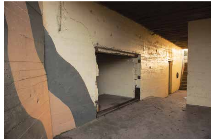
Ingang kanonremise, de originele camouflagepatronen zijn opnieuw geverfd