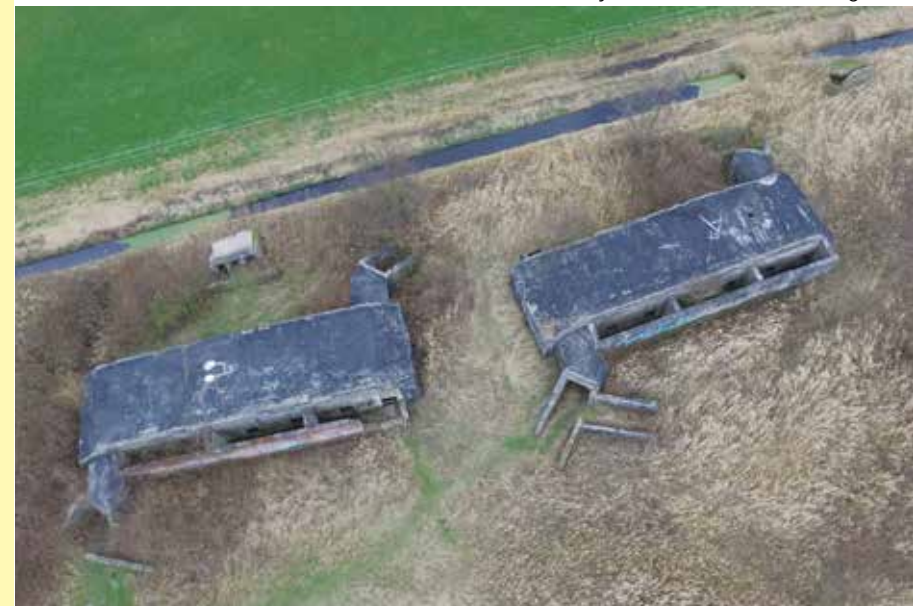
De twee hospitaalbunkers vanuit de lucht gezien. De daken zijn voorzien van een laag teer