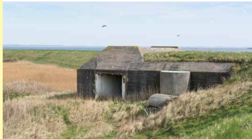
Manschappenbunker in de dijk bij het Grevelingenmeer

De Grevelingen stond tijdens de oorlog nog in open verbinding met de zee. Daarom moesten in de dijken aan de oostzijde van het eiland ook