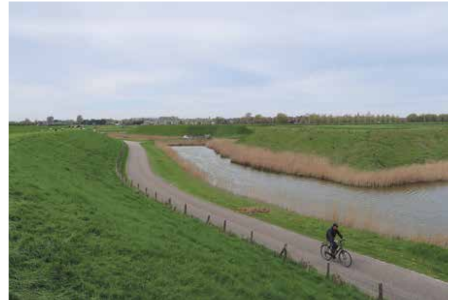
Fietsen langs eeuwenoude dijken en de Schans